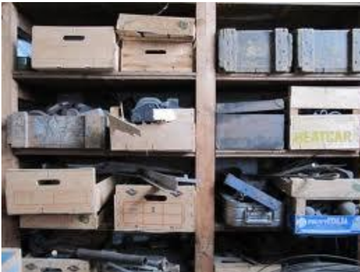
Eerdaags nostalgie: oude depot

Na een aantal weken klussen is de inrichting van ons nieuwe depot inmiddels afgerond en beschikken we nu over ruim 100 m lengte stellingplanken. In de tussentijd zijn er door de vrijwilligers op vrijdag ook nog ruim veertig depotkisten gemaakt, die precies op de nieuwe stellingen passen. Het is een keurige ruimte geworden met een constant klimaat.